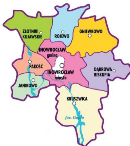
Rys. 1. Mapa obszaru LSR